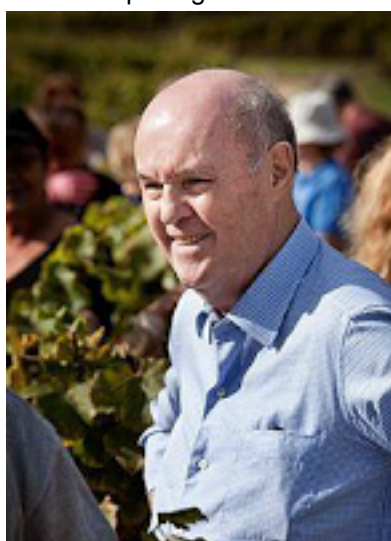
Portrait du Comte Alexandre de Lur Saluces

Philippe de Lur Saluces, fils du Comte Alexandre de Lur Saluces, fera déguster plusieurs vins du Château de Fargues à la boutique « Au Millésime » à Mulhouse, 1 rue des Maréchaux. Le secret du Sauternes du Château de Fargues, le savoir-faire et tous les mystères des terres bordelaises seront mis à nu lors de cette rencontre prestigieuse. # «Au Millésime» Mulhouse : 1 rue des Maréchaux, 68 000 Mulhouse